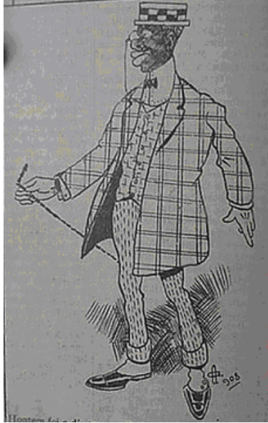
Fig.3 – O.G. A Rolha n.6 – 14/05/1908 Ontem foi o dia treze. Foi dizê a sinhazinha: Nego assim upitudarte. Nego hoje ta tudo esmarte

ser moderno não só no visual, mas também na fala. A liberdade também se conquistava pelas aparências. Ser livre e parecer moderno se traduzia pela entonação, pelos gestos, pelo visual.