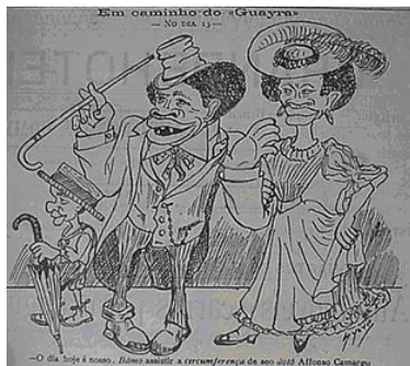
Fig. 4 – Sylvio. A Rolha n.6 – 14/05/1908 “ Em caminho do Guayra”

- O dia hoje é nosso. Bâmo assistir a circunferença do seo doto Affonso Camargo