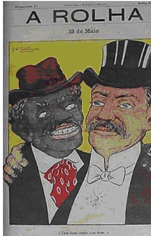
Fig.1 – Herônio. A Rolha n.6 – 14/05/1908 “ 13 de Maio” “ Tom bom como tom bom”

Para comemorar o dia da abolição, por exemplo, a capa de A Rolha (fig.1) mostra o branco e o negro, colocados juntos, abraçados. Estabeleceu-se um jogo de palavras entre o que é de bom tom e o tom de pele, uma distinção entre o que seria de bom tom: colocar tom sobre tom.