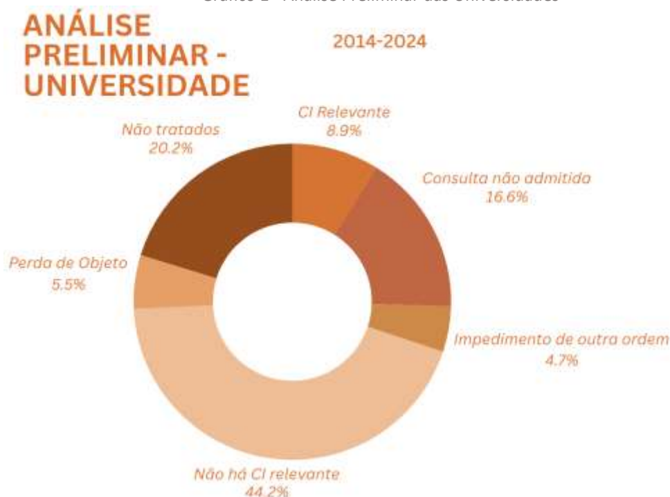
Gráfico 1 - Análise Preliminar das Universidades