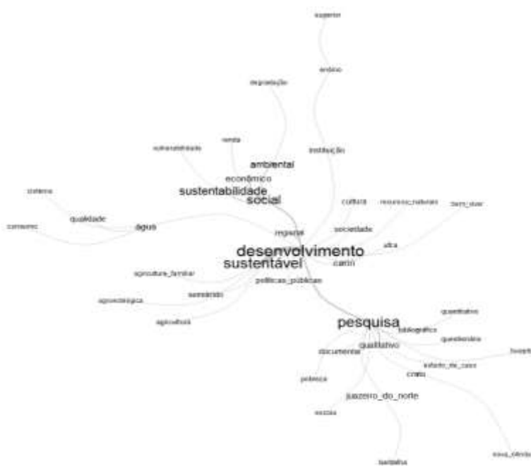
Figura 3 - AS do corpus de dissertações do PPG em DRS.

Em consonância com o ODS 6 (água potável e saneamento), que “destaca a necessidade de políticas eficazes e gestão integrada para garantir a segurança hídrica e a sustentabilidade ambiental” (PEREIRA et al. , 2024), evidencia-se que a gestão de recursos hídricos é eixo central dessas interconexões. A AS permite identificar temas para o mapeamento de suas interconexões: o grafo revela uma estrutura coesa em que “desenvolvimento” se articula fortemente com “pesquisa”, “políticas públicas”, “comunidade” e, notadamente, com elementos do contexto local, como a gestão de recursos hídricos e os municípios do Crajubar (Crato, Juazeiro do Norte e Barbalha), consolidando a identificação da rede sociotécnica na qual o PPG está inserido e atua.