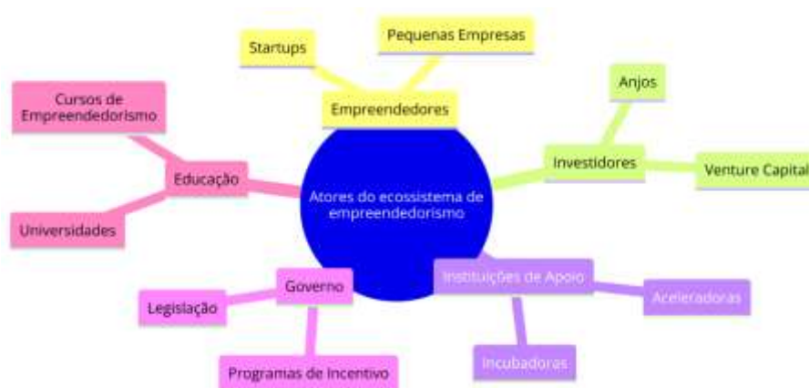
Figura 2 – Atores do Ecossistema de Empreendedorismo