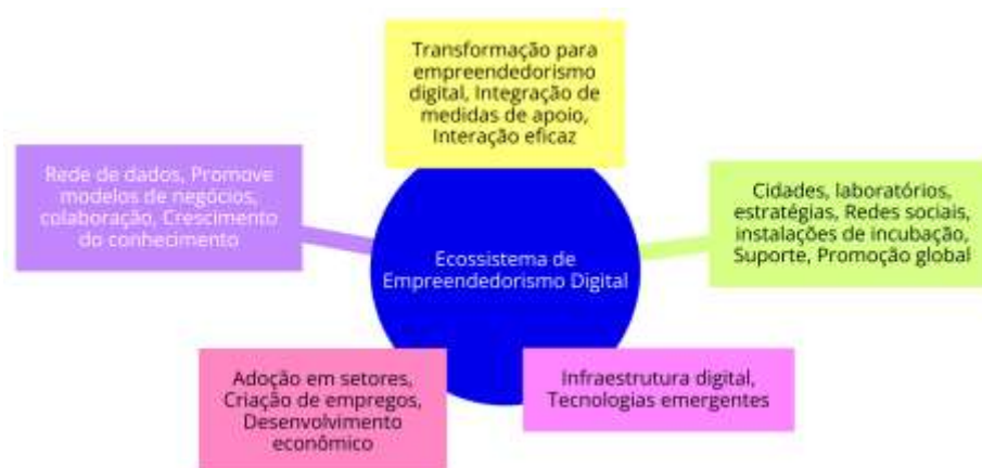
Figura 4 – Ecossistema de Empreendedorismo Digital