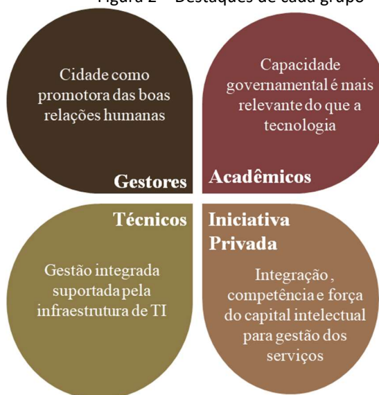
Figura 2 – Destaques de cada grupo

Em conformidade ao que se observa na literatura, as entrevistas também apontaram diversidade de entendimento sobre o conceito de smart city . No entanto, traços comuns puderam ser identificados, especialmente no que diz respeito ao uso de tecnologia como suporte, e não como finalidade. Além disso, observa-se em muitos dos discursos a consideração do conceito associado ao incremento na qualidade de vida. As boas práticas de governança e a integração de práticas e processos também são elementos destacados. As tendências específicas de raciocínio para cada grupo são apresentadas na figura 2.