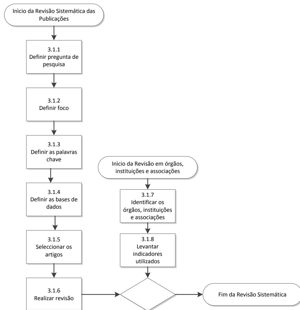
Figura 1 – Processo de revisão sistemática

Fonte: Baseado em Gohr et al. (2013) e Tranfield, Denyer e Smart (2003).