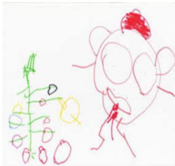
Figura 2- Arabescos infantis