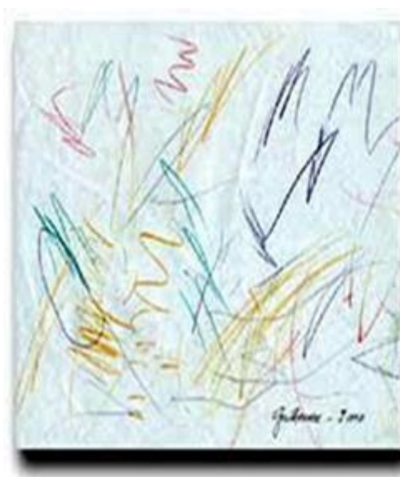
Figura 1 – Arabescos infantis

As figuras 1, 2 e 3 representam bem essas afirmações: