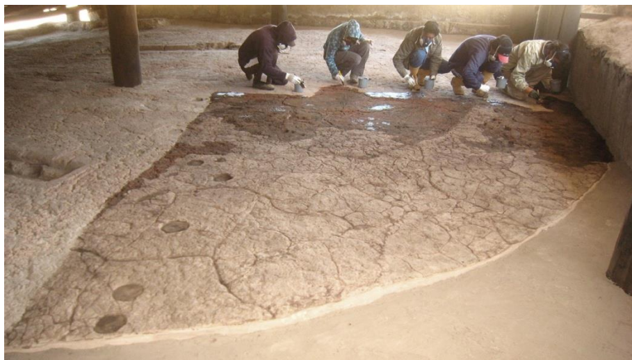
Figura 4 - Proceso de consolidación y protección final de plataforma cerámica superior.

La limpieza de las plataformas cerámicas y la eliminación de tierra superficial, al igual que la metodología e instrumentación afín a cada sustrato. Las labores de limpieza es necesario hacerlas de manera periódica, más incluso tras la intervención, porque la suciedad y polvo ambiental puede generar una serie de patologías encadenadas, que favorecen al detrimento del material cerámico. Por ello es conveniente concienciar a los trabajadores de que tras la restauración es necesaria una labor de mantenimiento constante.