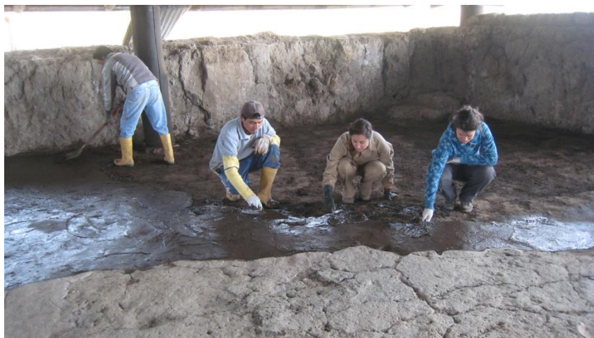
Figura 5 - Colocación de mortero sobre el suelo terroso, como medida preventiva de limpieza