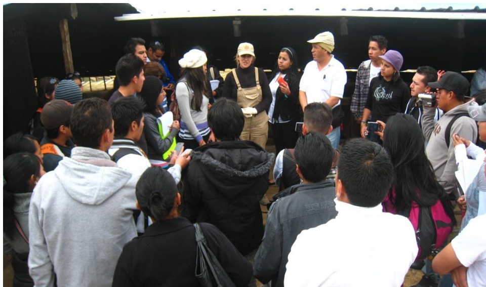
Figura 7 - Coloquio a los estudiantes de la Universidad de Ciencias Turísticas de Quito.

aplicados y por supuesto, la necesidad de proteger, conservar y difundir el Patrimonio Cultural, como elemento de identidad inalienable de una comunidad que es preciso por tanto, estimar, valorar y proteger.