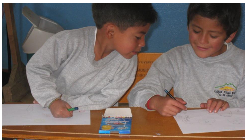
Figura 12 - Alumnos de la Escuela 13 de Abril de Cochasquí

Sobre los conocimientos acerca de las diferentes profesiones involucradas en el ámbito del Patrimonio Cultural y natural, los alumnos destacan la figura del arqueólogo y la del historiador, sin embargo desconocen otras como por ejemplo, la del arquitecto, los conservadores-restauradores, el personal de mantenimiento, los guías del Parque, e incluso la propia participación ciudadana, entre otros. En este caso los porcentajes de los resultados, tanto en el segundo y el tercer bloque, son semejantes.