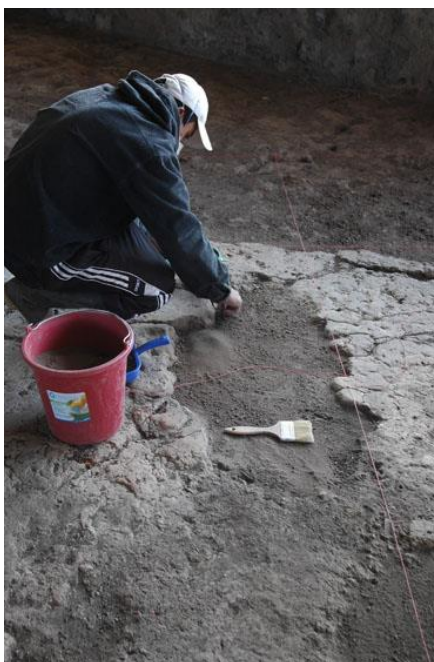
Figura 3 - Personal de mantenimiento realizando una nivelación de lagunas

La expectación generada tras el primer curso formativo llevó a un aumento considerable en el número de participantes en la segunda capacitación del 2012, con casi el total de la plantilla. Ésta tenía por objetivo la instrucción en técnicas de restauración y reconstrucción formal, con el fin de mejorar la lectura del conjunto cerámico.