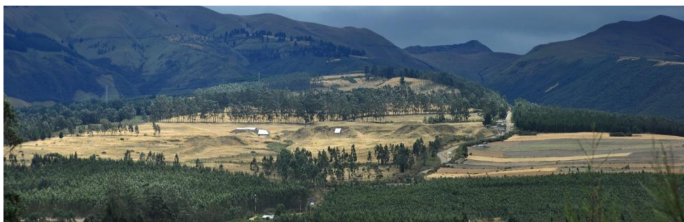
Figura 1 - Vista general de las pirámides de Cochasquí.

A partir de los estudios multidisciplinarios que se han ido desarrollando, se ha llegado a la conclusión de que nos encontramos ante unas manifestaciones arqueológicas que reflejan un gran valor histórico-cultural para el patrimonio nacional ecuatoriano. Siendo reconocido por su valor y significancia en algunas de las reuniones de la UNESCO, así como en varios foros nacionales e internacionales.