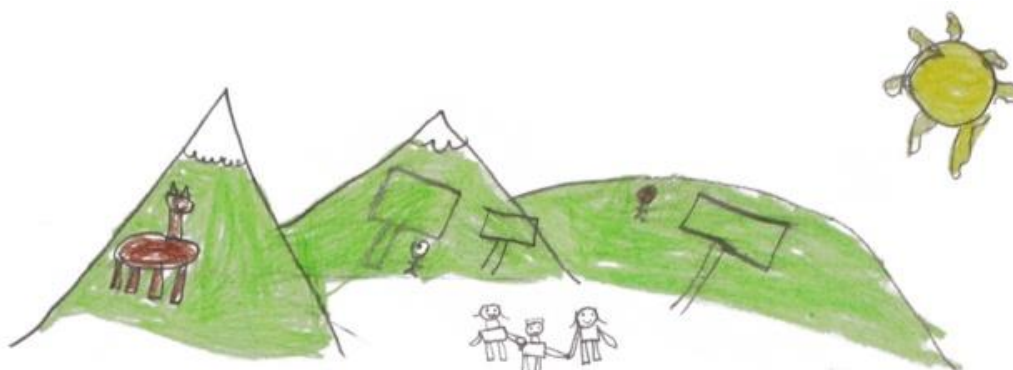
Figura 11 - Dibujo realizado tras la experiencia, por un alumno de la Escuela 13 de Abril de Cochasquí

Por otra parte, alrededor del 70% de los alumnos del segundo bloque manifiesta una elevada voluntad en la salvaguarda de estos testigos culturales, pero debido mayoritariamente al importante valor económico que le atribuyen, y al importante valor histórico de los mismos. Sin embargo esta opinión es compartida por el alumnado del tercer bloque, según lo muestran las estadísticas con un 84%.