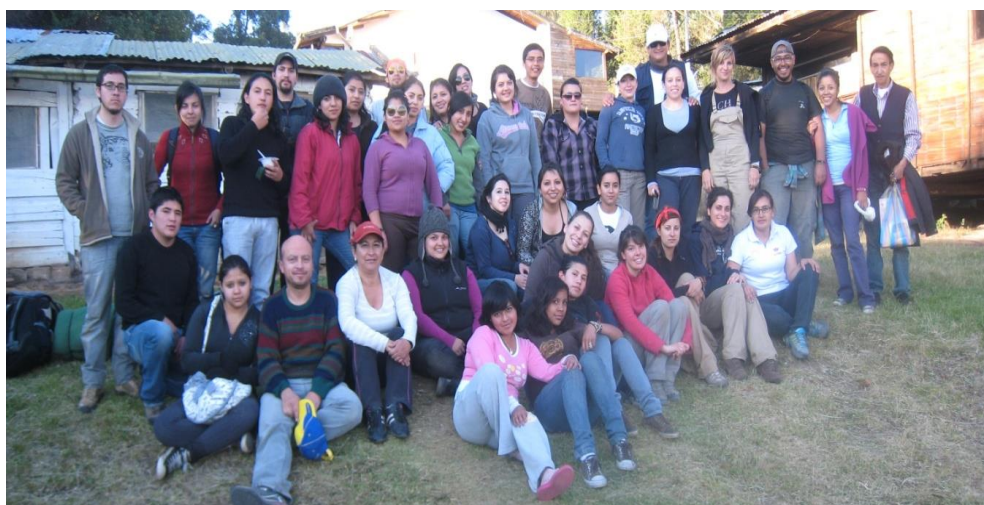
Figura 6 - Fotografía del grupo de estudiantes que participaron en el seminario durante el 2012

Señalar asu vez, este curso estuvo complementado con prácticas in situ en colaboración con el personal técnico del proyecto, lo que les permitió desarrollar los conceptos teóricos aprendidos, dando como resultado la sensibilización en cuanto a la dificultad que entraña la conservación de material arqueológico al exterior. El éxito del curso y las sesiones prácticas desembocó en el interés de 9 estudiantes en realizar pasantías de 3 semanas en el sitio arqueológico, en colaboración con los técnicos del proyecto y el personal trabajador del Parque Arqueológico de Cochasquí.