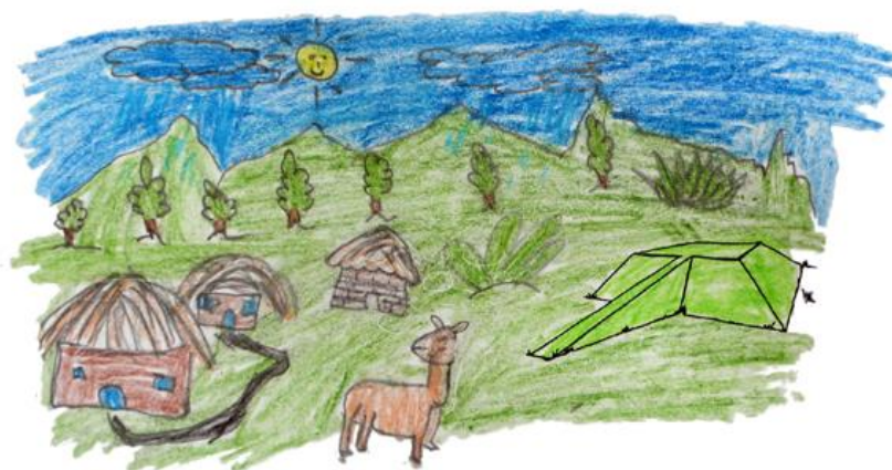
Figura 13 - Dibujo de libre interpretación de un alumno de la Escuela 13 de Abril de Cochasquí

vestigios del pasado. Esto significa desarrollar una comprensión mayor de los valores representados por los propios Bienes Culturales, así como respetar el papel que desempeñan tales monumentos y emplazamientos en la sociedad contemporánea.