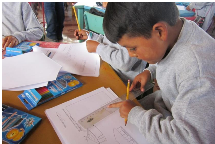
Figura 9 - Alumnos de 8º curso del Colegio Nacional de Malchinguí, realizando la encuesta final y el dibujo de libre interpretación