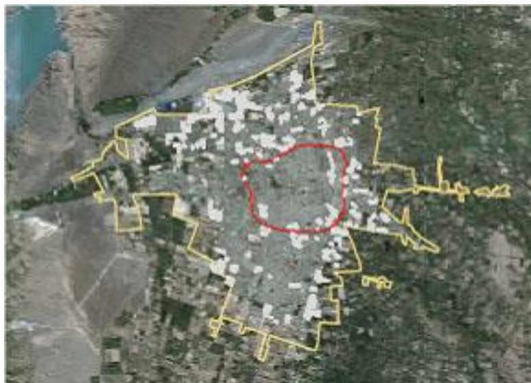
Figura 4 – Grandes áreas vacantes dentro del límite urbano

Fuente: Los vacíos urbanos se muestran en la imagen, en blanco sobre la planta urbana en gris. El área agrícola se observa en color verde y el límite urbano actual se corresponde con la línea amarilla.