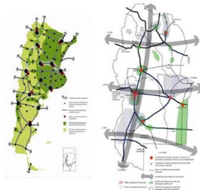
Figura 2 – Escenario territorial de los equilibrios dinámicos – Argentina 2026 – para el país y la región de Cuyo.