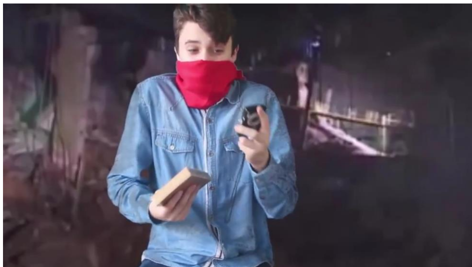
Figura 3- Estudante interpretando um aluno que está coletando informações para seu trabalho de conclusão de curso