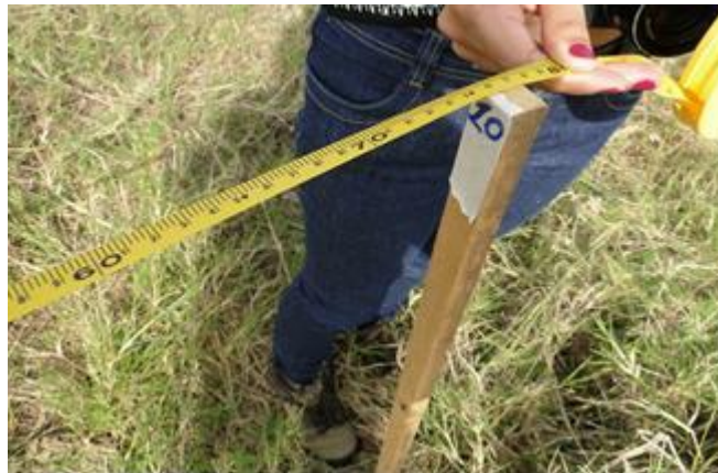
Figura 6: Medindo a distância entre as estacas

Com esta prática, trabalhamos o conceito de tipo de ângulos e trigonometria. Uma vez determinado o ângulo \alpha , medimos a distância entre os pontos 1 e 2 e depois entre os pontos 2 e 3, com o auxílio de uma trena de 50 metros, com isso determinamos a medida dos lados, como ilustra a figura 4, processo repetido em todos os vértices da poligonal, demarcado pelas estacas.