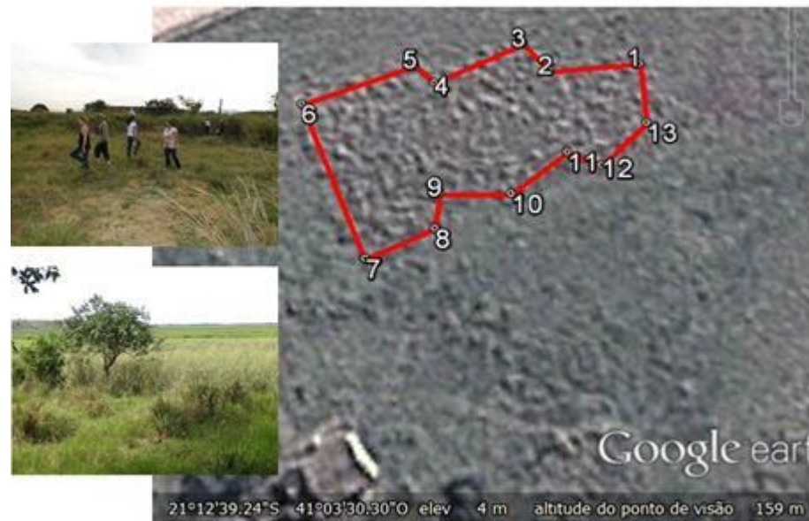
Figura 7: Representação da poligonal no Google Earth