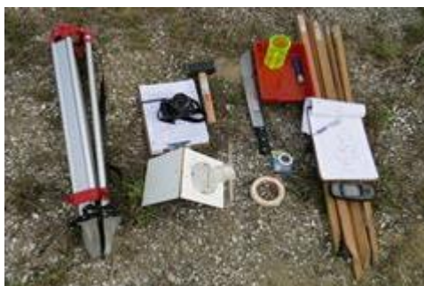
Figura 1: Ferramentas utilizadas no campo

O objetivo da investida de campo foi trabalhar diferentes práticas de ensino, sob diferentes olhares, interagindo conteúdos de três disciplinas, a fim de um propósito maior: o conhecimento e a delimitação do sítio arqueológico, visando a explorar a região sem danificar ou intervir fisicamente na mesma, a fim de contribuir para sua preservação. Nesse trabalho, temas socioambientais também vieram à tona. Para tanto, foram utilizadas as seguintes ferramentas para a realização da prática: trena, teodolito caseiro, GPS (Sistema de Posicionamento Global), máquina fotográfica, tripé, estacas e pranchetas, conforme figura 1 a seguir.