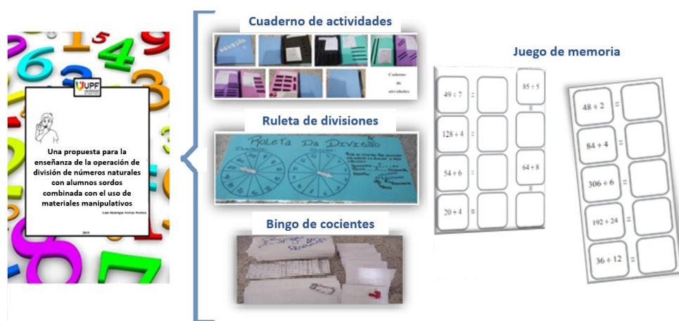
Figura 2 – Producto educativo desarrollado

Se planificó un módulo didáctico que incluye el material manipulativo elaborado, en este caso un libro de actividades en etilvinilacetato (goma EVA), una ruleta de divisiones, un bingo de cocientes y un juego de memoria. Así como la secuencia didáctica que incluye estos materiales en las clases de Matemáticas. Como se puede observar en la imagen abajo: